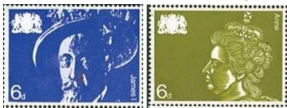
شكل (9) و(10)

المجتمعية والثقافة الشعبية في بلده فهو متأثراً في مواضيعه بكل ماهو متداول في الحياة اليومية، اذ (( استعمل المصمم جنتلمان في وصف عملياته الإبداعية المختلفة الرسم بالقلم الرصاص والنقش على الخشب والألوان المائية بتوظيفه لرأس الملكة اذ ظهر نقش الخشب بصورة الملكة الظلية بوصفه شعار دائم ومبدع، كما يشير عمله الى مزيج من المهارات الفنية المتقنة والرسوم التوضيحية الحساسة التي تدعم النظرة المستقبلية الصعبة التي تصنفه رائد رئيس في الحدائة البريطانية)) (Czerwinski، 2015) كما انعكست المعطيات الاسلوبية لفن البوب ارت من خلال اعتماد المصمم على الاشكال والرسوم الجاهزة بأسلوب حربي وباستخدام الشكل والمادة. كما في الشكل (9) و(10)