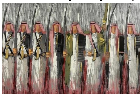
شكل (1) عبد الله بن صقر - ألوان اكريلك، قماش -150×250-2014م.

https://www.instagram.com/p/CRL6ZZHBeZn/?igshid=NTc4MTIwNjQ2YQ