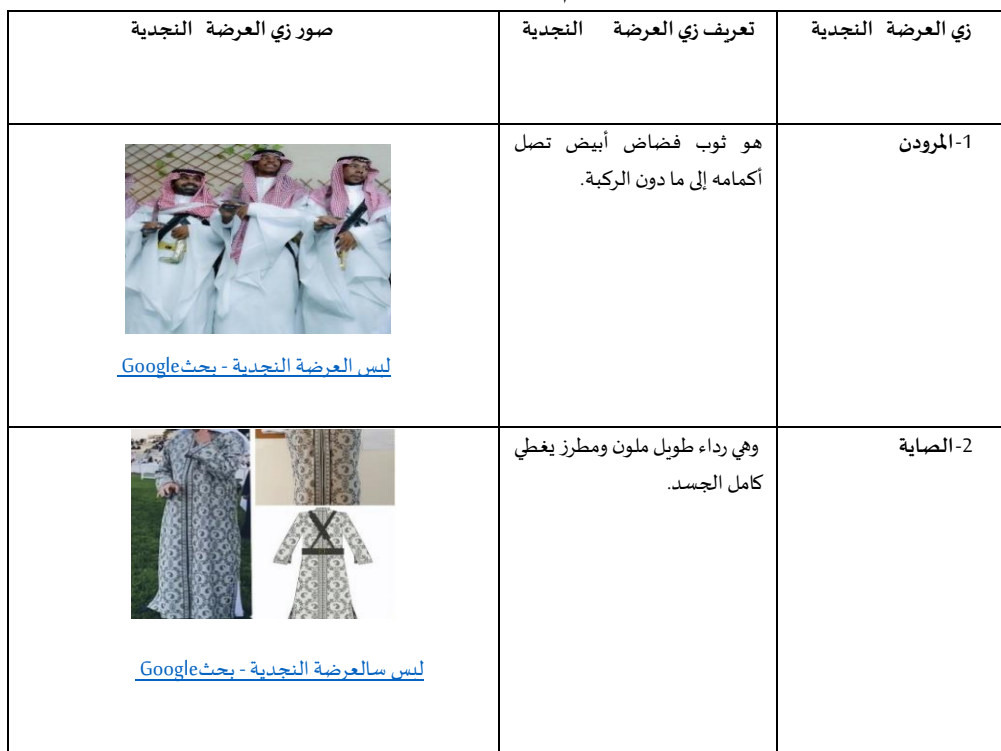
لبس سالعرضة النجدية - بحث Google

1- المرودن 2- الصاية 3- المحزم 4- الجنبية.