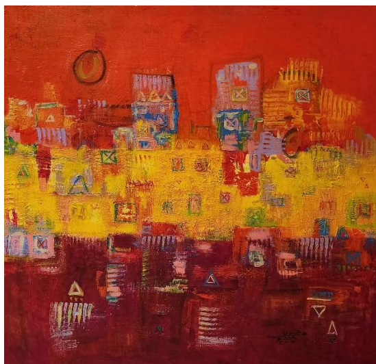
شكل ( 13 ) عمل الباحثة - ألوان اكريلك على كانفيس - 100100xسم - 2023م.

يتكون هذا العمل من أجزاء هندسية تظهر بمستويات متعددة في تركيبها عبر الخطوط والألوان يربطها مجموعة من العلاقات الشكلية المتجانسة بتفاصيل مختزلة في بنائها الشكلي فضلاً عن التصميم الهندسي الذي منح العمل الفني كتلة تكوينية. أكدت الفنانة على تكرار المثلث حيث يعد من رموز الموروث السعودي، ويعد الأسلوب المتبع في تنفيذ هذه اللوحة تابع للمدرسة التجريدية الهندسية برزت فيه التفاصيل الرمزية للعناصر التراثية التي قدمت بطابع تجريدي هندسي. وتم تحقيق الإيقاع الحركي من خلال التكرار اللوني، وتكرار العناصر الهندسية الزخرفية المتمثلة في المثلث والمربع والمستطيل، وكذلك برز الإيقاع، وتحقق التوازن في العمل من خلال الخطوط الأفقية والرأسية، ويعد التكوين العام للوحة ساعد على انتقال العين بين الأجزاء والتفاصيل بسلاسه وانسيابية.