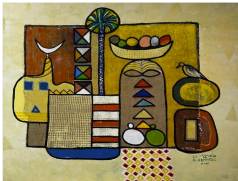
شكل (7) عبدالله حماس، الوان اكريلك على كانفس، 120×200سم، 2021م. https://www.instagram.com/p/CTpEjmyqMvo/?igshid=OTRmMjhlYjJM%3D

سعى الفنان لتحقيق التناغم البصري عبر الخط واللون والملمس حيث نجد الاهتمام بالملامس واضحاً خلال العمل الفني من حيث طباعة الحروف والزخارف الإسلامية، وأيضاً تكرار عناصر الزخرفية بشكل دائري في المنتصف. نجد التناغم بين المربعات الغامقة والفاتحة على يمين اللوحة وأيضاً بين المعينات في