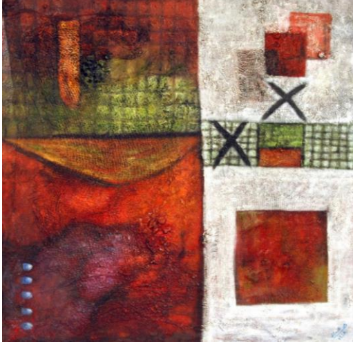
شكل (10) عمل الباحثة - الوان اكريلك على قماش - 100×100سم -2022م.

تم تأسيس أرضية العمل بالجسو وبقماش الخيش لعمل تأثير الشبكة مع تنفيذ تقنيات بارزة على سطح اللوحة التشكيلية بأداة السكين والكشط وعمل ملامس متنوعة، في الجزء السفلي تم إضافة خامة ليف النخيل لعمل ملمس بارز لإثراء سطح اللوحة بملامس متنوعة من الخامات. الموضوع مستوحى من التراث الشعبي للبيوت الشعبية بمساحات لونية من اللون الأحمر والبرتقالي والأخضر بدرجاتهم واللون الأبيض، استخدم اللون الأسود لتحديد بعض الأشكال، نفذت اللوحة بأسلوب تجريدي هندسي مستوحاة من أسلوب موندريان في تقسيم الأشكال الهندسية من مربعات ومستطيلات متنوعة في الأحجام.