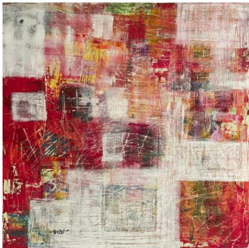
شكل (11) عمل الباحثة – ألوان اكريلك على قماش – 80×80سم -2023م.

العمل يصور مجموعة من البيوت القديمة موزعة على سطح اللوحة ومجردة من التفاصيل وقد وزعت الألوان بالسكين وتقنيات الفرشاة البارزة مع استخدام أداة الخدش والسكين لعمل الخطوط البارزة وأداة الكشط لسحب ودمج الألوان مع بعضها البعض والتي أكسبت العمل الفني تناغم وإيقاع أثرى مسطح اللوحة.