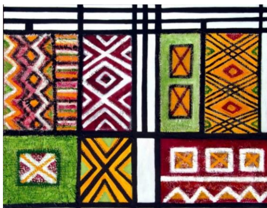
شكل (9) عمل الباحثة - ألوان اكريلك على قماش - 80×60سم - 2022م.

الموضوع مستوحى من التراث الشعبي للزخارف الشعبية حيث تم تجسيد اللوحة بأسلوب تجريدي هندسي وذلك من خلال مساحات لونية من اللون الأحمر والأصفر والأخضر بدرجاتهم واللون الزهري والأبيض؛ واستخدام اللون الأسود لتحديد الأشكال والزخارف وعلى طريقة أسلوب موندرينان في تقسيم أجزاء اللوحة بخطوط أفقية ورأسية متعامدة. وزعت الألوان بتقنيات الفرشاة الجافة لإبراز ملامس خلفية العمل ولدمج الألوان مع بعضها البعض والتي أكسبت اللوحة ثراء ملمسي بارز، كما أن تنوع