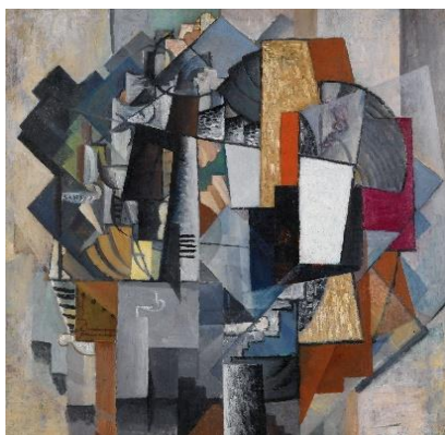
شكل (3) كازمير ماليفتش Kazimierz Malewicz