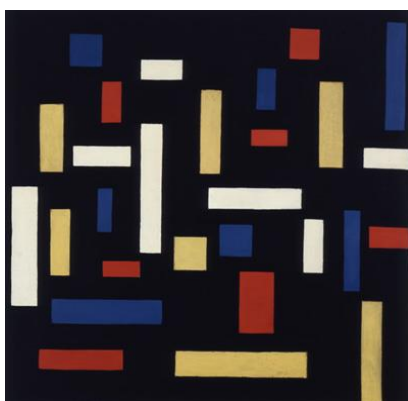
شكل (4) ثيو فان دوشبرغ Theo van Doesburg

https://en.wikipedia.org/wiki/Piet_Mondrian