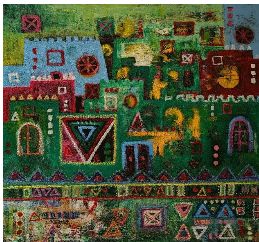
شكل (12) عمل الباحثة – ألوان اكريلك على كانفس – 100×100سم – 2023م.

اعتمدت الباحثة على اللون بشكل أساسي لإبراز تفاصيل وملامح العمل من خلال التأكيد على اللون التي تتغير درجاته ومستوياته بتغيير كثافة اللون والمادة مما أدى ذلك الى تنوع في القيم الملمسية للعمل الفني، بالإضافة الى الأشكال الأخرى من المربعات والمستطيلات والدوائر نجدها مرة غائرة وأخرى بارزة تتجانس فيها الألوان والتقنيات لإضفاء حركه ملمسيه على سطح العمل الفني ذو تأثير على المتلقي. تظهر قدرة الفنانة وابتكارها في تركيب التكوين وتنوع عناصرها وتقنياتها المستخدمة في هذا العمل وفي كيفية التعامل مع السطح والمساحة والفراغ.