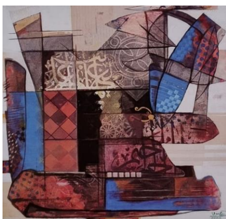
شكل(6) حسن علي الغامدي - اكرليك على كانفيس - 50×50 سم -2020م. المصدر ( من الفنان عبر الايميل)