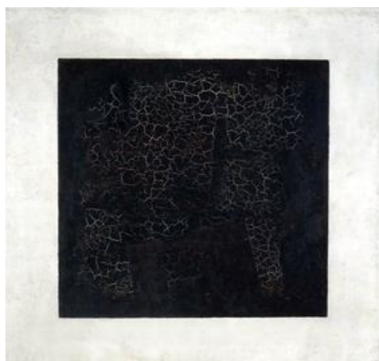
شكل (1) كازيمير ماليفيتش، ألوان زيت على قماش

قام الفنان كازيمير ماليفيتش عام 1915 م وهو أحد رواد الفن التجريدي الهندسي " بتقديم أكثر قطعة فنية شهرة في هذا النوع من الفن والتي تسمى المربع الأسود بجانب سلسلة من اللوحات الفنية التجريدية الهندسية والتي قدمها كازيمير بالألوان المحايدة من الأبيض والأسود، حيث قام بالترويج للقيم الرياضية بعد أن رفض الفن السائد في ذلك الوقت فاتحا بذلك الأبواب أمام تجارب جديدة وتيار جديد من الفن والذي استمر في تطوير أعماله في الفترة بين 1912 و 1923 م." (mawdoo3.com) .