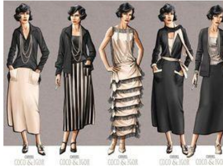
تصميم المصممة ايف سان لوران

كانت المصممة العالمية المبدعة (كوكو شانيل) أول من أستفاق على التطورات التصميمية الجديدة وكانت رائدة في تصاميم الاقمشة والازياء التي أحدثت ثورة في عالم الازياء وذلك بالعودة الى الاساسيات التي أحتفظت بالاناقة والاصالة وعلى ما أنجزته كوكو شانيل خلال تلك التأثيرات المهمة التي أحدثتها ، ولقبت بالقائدة المصممة حتى وفاتها في 1971 وظلت تأثيراتها فيما بعد الى يومنا هذا ، إذ لا يستطيع مصمم الازياء المعاصر أن ينسى ما أحدثته شانيل وما جادت به من عطاء ثر سيظل خالدا على مر الزمن ، وقد أثرت في تحرر المرأة بما حققته من تصميمات مستحدثة تركت بصمة جمالية مهمة على أزياء النساء في القرن العشرين بل أحدث ثورة في صناعة الموضة ، اذ كانت تصميماتها تتماشى مع الجسد وكانت ادواتها هي الجودة والراحة والنسب التي تبرز جاذبية الجسد دون كشفه (Justine.2009.p.98)