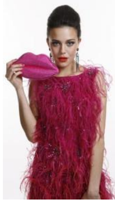
تصميم للمصممة السا سكاپريللي

ولا ننسى موهبة المصممة شابريللي التي استلهمت العديد من المفاهيم الجمالية التي تفاعلت مع الفن التشكيلي والاداب والمسرح فشاريللي هي المصممة التي لخصت تلك المفاهيم في تصميم الأزياء وواعزت الى ظهور الموضة بما انجزته من تصميمات مبتكرة على غرار ما شهدناه بالفنون الأخرى من تغييرات عميقة في الجوهر الابداعي وكانت شابريللي من ابرز المصممين الذين ظهروا في تلك المرحلة الى جانب عدد اخر من المصممين الموهوبين (Alia.1995.p.75) (♥)