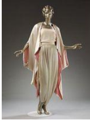
تصميم للمصمم بول بواريه

اما المصمم الذي يعد واحدا من أبرز مصممي الأزياء في العالم خلال النصف الثاني من القرن العشرين هو المصمم (أيف سان لوران) (♥) الذي عرف بأسلوبه الثوري وكان يسعى الى إيجاد تغييرات كبيرة عبرت عن روح المعاصرة ، وأحتلت تصاميمه مركزا لامعا في تصميم الأزياء النسائية التي تأثر بها الكثيرون من مصممي الأزياء كما تأثر بها المتذوقون على ما أتى به من مظهرات أبداعية متجددة حملت في بيانها علامات العبقرية التي كان يتمتع بها هذا المصمم (Alia.1995.p.87)