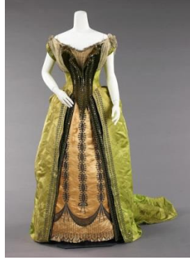
تصميم للمصمم فريدريك وورث

ولعل ظهور الموضة بشكل ملفت للنظر اواخر القرن التاسع عشر وبدايات القرن العشرين قد تعرى عن تلخيص مهم للمفاهيم الجمالية التي انتجت على ضوءها الازياء فاضحت لها رؤية تجديدية قادها مصممون كبار الى ان تكون طرازا جديدا للازياء يتأثر بالحاضر متأثرا كبيرا من شأنه الاهتمام المحض بالجديد والاهتداء بمفاهيم الحداثة التي كانت تنبذ الماضي وتدعو الى بناءات مبتكرة تنظر الى المستقبل بتفاؤل فاصبح مصمم الازياء مبدعا حرا من حيث المبدأ يعمل بلا قيود في الواقع ، حيث تغيرت المفاهيم والمنظومات الفكرية التي ترعى تصميم الازياء باعتباره فنا يمثل الحياة العامة وما تزهو به من جماليات لها تأثير كبير على نشأة الحرية والافكار الداعية الى الجمال باعتباره الغاية المثلى للمجتمعات المتقدمة