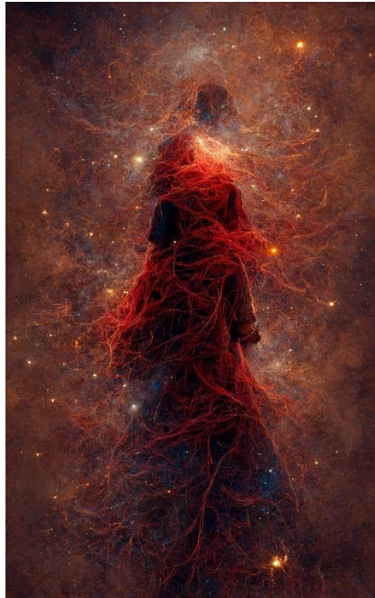
من أعمال الفنان خالد الأمير (Alameer, 2020)

سجلت أوائل التسعينات من القرن العشرين الدخول الحقيقي للفن الرقمي إلى المملكة العربية السعودية، ولكن بداية دخوله في الإجمال لم تستهدف إنتاج أعمال فنية رقمية في المقام الأول، إنما كان تواجهه لأغراض تجارية بحتة تمثلت في تصميم الإعلانات والمنشورات المرتبطة بالأعمال، وقد لعبت برامج الفوتوشوب والكورال دوراً بالتحديد أدواراً مهمة في ذلك المجال (Alqarni, 2020. 340). كما كان للصحف المحلية دور ملحوظ في إدخال التقنيات الرقمية للتصميم البصري في ذات الفترة وذلك من خلال برامج النشر المكتبي الرقمية، وكذلك استخدام الرسم الرقمي في الرسوم التوضيحية وفي إنتاج الكاريكاتير الصحفي في فترات لاحقة. ولا يمكن إغفال دور معامل التصوير في تلك الفترة التي بدأ منها تشكل الفن الرقمي السعودي (Albuqami, 2021. 51). في عام 1995 بدأ الفنان خالد الأمير في الممارسات الجادة لإنتاج أعمال فنية باستخدام الحاسب الآلي (Almaliki, 2019)، وفي عام 1996 بدأ الفنان أحمد القاضي في تجربة إنتاج أعمال فنية رقمية من خلال برامج الرسم المتوفرة في ذلك الوقت (Algamash, 2017. 103)، كما أنتج الفنان فهد الحجيلان -رحمه الله- والفنان فيصل المشاري أعمالاً فنية رقمية لصالح صحيفة الجزيرة في ذلك العام الذي شهد منافسة بين بعض الفنانين لاستخدام هذه التقنية الحديثة في الإنتاج الفني (Almishari, 2012. 3).