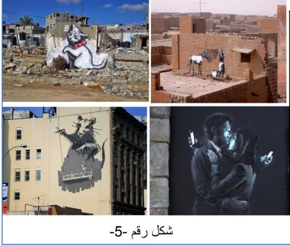
شكل رقم -5-

لقد تحول (تاكى 183) الى ظاهرة اثناء الاربعين سنة الماضية واصبح اغلب رسامي الغرافيت الامريكيون خصوصا يمجّدونه وحتى يوقعون اعمالهم باسمه حتى وصل ان استغلت الشركات شهرته فبدأوا باستخدام اعماله للترويج لمنتجاتهم (شكل رقم -4-) وبهذا الصدد يكتب برين جونيلا Brian Gonnella دعونا نتفحص فن: الغرافيتي :- هو صحيح غير قانوني. وترفضه الأعراف المجتمعية ويوصف بأنه سرطان للمجتمعات، وهو فيروس مدمر يستهلك ويلتهم القيم الصحيحة اللائقة و يظهر كمنزل متصدع مجاور يشوه المنظر أو ربما هو مجرد ان منفذه ضحية أخرى للاغتراب الاجتماعي التي ذكرها كارل ماركس. لنكن