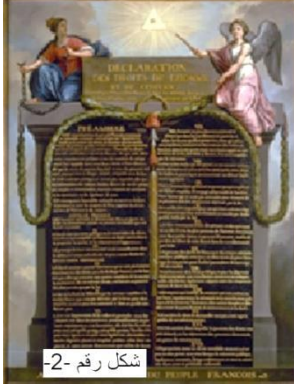
شكل رقم -2-

رسامون مثل جان بابتيست لالاماند Jean-Baptiste Lallemand وديجون De joun كانا أعضاء في أكاديمية سانت لوك وعلى الرغم من أعمالهم الباباوية السابقة ، فقد راقبا مسار الثورة أثناء تطورها ، وقدموا أعمالاً لمشاهد النضال الشعبي من أجل الحرية ، ففي أعمالهم لا توجد شخصيات يمكن تمييزها في تلك المشاهد ، ناهيك عن عدم وجود بطل الرواية. لم يكن هناك اهتمام بإنتاج سرد كبير لابطال الثورة ، أو حول الأشخاص المشاركين فيها. بدلاً من ذلك ، أرادوا التقاط التجربة من منظور (الشعب).