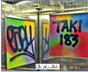
شكل رقم -3-

ثانياً / مرحلة ما قبل مواقع التواصل الاجتماعي