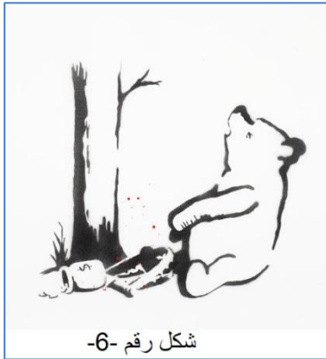
شكل رقم -6-

الفنان الإنجليزي بانكسي (Banksy) والتي تعد اعماله الغرافيت الاغلى في العالم (شكل رقم -5-مجموعة من اعمال بانكسي) في