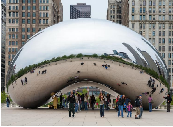
شكل رقم (5)

ومن خلال التحليل السابق للعمل يتبين للباحث أن الفنانة استطاعت أن تجعل من الخامات المستخدمة سبيلاً مباشراً ووسيطاً إبداعياً لمعرفة مضامين العمل والوصول إلى رمزياته، وبالتالي استطاعت أن تلخص مجموعة من القيم التشكيلية والتعبيرية وعلاقتها الجمالية مع الخامات المستخدمة، ففي عمل النهر للفنانة جيردا نستطيع القول بأن اختيار الخامات للعمل الفني المجهز في الفراغ هو دليل على قوة وممارسة الفنان وكثرة التجريب، التي من خلالها يستطيع أن يصل بأفكاره ومضامينه إلى مخيلة المتلقي ويجبره على التفاعل والوقوف أمام العمل واثارة الفضول والتساؤلات.