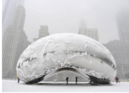
شكل رقم (6)

ومن وجهة نظر الباحث يمكن القول إن بوابة السحاب حقق الفنان من خلاله علاقة جمالية بين الخامة المصقولة العاكسة باعتبارها وسيط ابداعي في عمل بوابة السحاب، وبين القيم التشكيلية والتعبيرية المتضمنة في هذا العمل، وبالتالي عكس فكرة التواصل والتفاعل بين الناس والفضاء الذي يعيشون فيه، من خلال دمج السماء والوانها وتغيرات الطقس عليها والمدينة وحيويتها في تجربة بصرية واحدة، ومن خلال بوابة السحاب يطرح كابور أسئلة وأفكار وقيم تعبيرية حول الهوية، والانتماء، والوجود.