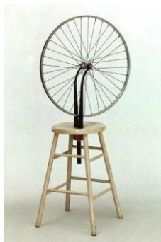
شكل رقم 1) Marcel Duchamp, Bicycle Wheel, 1963

يستغل الفنان المعاصر الخامات والوسائط المتاحة له بصورتين، أما أن تكون الخامة هي الموضوع والعنصر الرئيسي بالعمل الفني، أو وسيط مضاف للموضوع الأساسي، فنلاحظ في أحد أعمال دوشامب استخدام العجلة في صورة خامة بصفتها موضوع للعمل كما موضح في الشكل (1)، بينما استخدم بيكاسو قصاصات الورق (collage) خامة وسيط مضافة للموضوع وليس هي أساس الموضوع كما نلاحظه في الشكل (2)، نلاحظ هنا استخدام بيكاسو الخامات الورق كوسيط إضافي في العمل. ويرى الباحث إن الخامة أحيانا تكون هي الموضوع بمعنى هي العمل بحد ذاته أما الخامة الوسيط فهي خامة مضافة للعمل وقد تدخل فيها المعالجات التشكيلية.