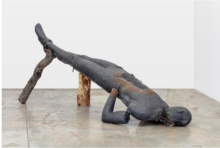
شكل رقم (3)، عمل مجهز في الفراغ بعنوان جزيرة السماء، ريزن وخشب ومعادن، 2020، إميل الزامورا

Installed work in space entitled, Sky Island, resin, wood and metals, 2020, Emil Alzamora