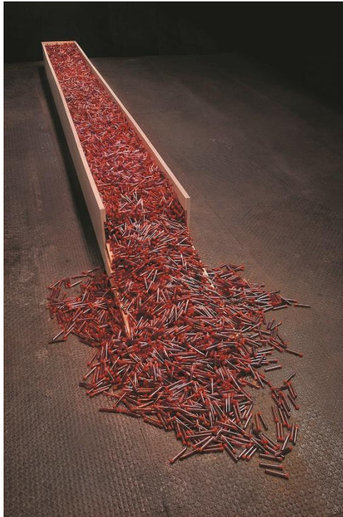
شكل رقم (4)

ويرى الباحث ان الزامورا قد حقق العلاقة الجمالية بين الخامات كوسيط وبين القيم التشكيلية والتعبيرية التي استطاع الزامورا Emil Alzamora تحقيقها من خلال تعامله وتعاطيه مع الفراغ واختياره للخامة في عمله جزيرة السماء المجهز في الفراغ.