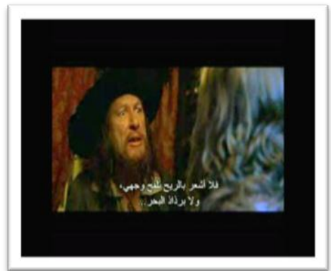
صورة رقم (2) هنا نرى صورتين والتي يتحول بها شخصية (باربوسا) من شكل بشري الى شكل غرائبي