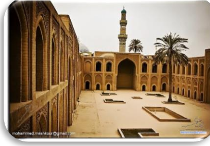
شكل رقم (5)