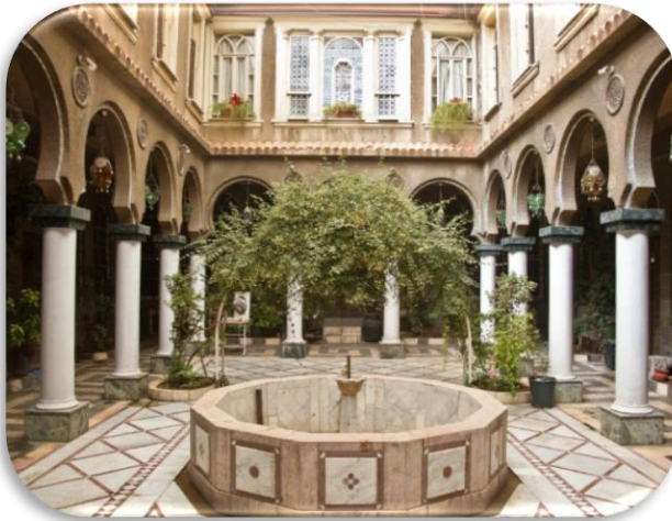
شكل رقم (1)

في حين عد ( الآخر) في التصميم الداخلي من ناحية أخرى الانفتاح على ثقافة الآخر وتقبله شكلاً وموضوعاً من خلال الافادة من التطورات التكنولوجية الحديثة فكراً وتطبيقاً مع الحفاظ على ( الأنا ) او ( الذات) التي ترجمت في التصاميم الداخلية الى الهوية والحفاظ عليها وعلى ثقافة الشعوب وعاداتها وتقاليدها التي تعد من الشروط الضاغطة والهامة في اي بناء فكري تصميمي متوافق مع بيئته وعصره ، كما موضح في الشكل رقم (1) .