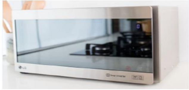
شكل (1) الهيئة الخارجية لفرن الميكرويف الذكي

قام الباحث بإختيار عينة بالطريقة القصدية من مجتمع البحث الأصلي وقد مثلت نسبة المنتجات (10%) من مجتمع البحث الاصلي والبالغ (20) منتجاً، وذلك لإختيار النماذج التي تخدم هدف الدراسة والأقرب الى تحقيقها والبالغ عددها (2) نماذج. انموذج (1) فرن الميكروويف الذكي.