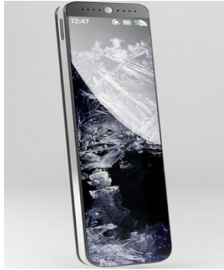
شكل (3) يوضح توظيف خامات ذات صفات معينة

فقد وظفت التقنية في هذا النموذج احساس مادي حقيقي للخامات المستعملة لتحقيق صفات ايحائية معينة لتوحي بخفة الوزن لتلافي الوزن الكبير المكون للجهاز، مع اعتماد الاتفاق التكويني للجهاز والخامة التي صممت له وبتاثير مباشر على التصميم كونها مؤثرة ومتاثرة بالبيئة المحيطة بالتصميم او على المستوى المعنوي لما تحتويه من اثر لبيان الخصائص الهندسية الظاهرية، والجوانب الجمالية لتكون صيغة ملموسة ومحسوسة تنسجم والصيغة التعبيرية التي وظفها المصمم بنضج ووعي فني كامن لتتناسب مع وظائف الهاتف، ونلاحظ اهمية القيمة الضوئية ومقدار انعكاسها من على سطح الهيكل الخارجي للهاتف، مما يدل عل كونه سطح ناعم الملمس يعتمد تاثيره على نوع الخامة المستخدمة بتوضيح الاتفاق التكويني للجهاز والملمس الذي صمم له وليعطي الاحساس الحقيقي للخامات المستخدمة وليؤدي تاثيره المطلوب بالنسبة لعلاقته مع العناصر البنائية الأخرى او تاثيره على المتلقي ساهمت في تحقيق العلاقات الرابطة للشكل وصفاته المظهرية ممثلة باللون وشكل والاتجاه والملمس وغيرهما من عناصر البناء الأخرى التي تمتلك الفعاليات الواسعة لاثارة الجذب. شكل (3).