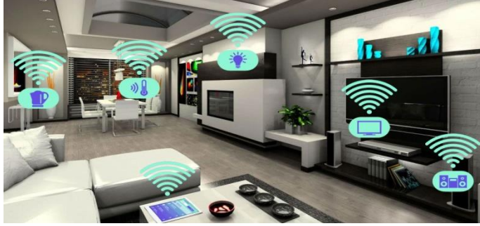
شكل (2) اجهزة شركة (LG) المنزلية الذكية ذات الجودة العالية

فقد اصبحت الجودة عاملاً مهماً في اختيار المستهلك ، لذلك ينبغي أن تأخذ بالاعتبار كيف يعرف المستهلك الجودة ، يقول ( ادوارد ديمينج W. Edwards Deming ) ( كاتب ومحلل) المستهلك هو جزء مهم في خط الانتاج ويجب أن تهدف الجودة الى تلبية حاجات المستهلك " ، ومن وجهة النظر هذه فإن جودة المنتج تتحدد بما يريده المستهلك وما يرغب في أن يدفع ليحصل عليه ، ولأن المستهلك لديه العديد من الاحتياجات فإن توقعاته عديدة للجودة . ومن هنا تؤدي بنا هذه النتيجة الى تعريف الجودة والبحث في مدى ملائمة السلعة والخدمة للأغراض التي وضعت لأجلها أو مدى ملائمتها للاستخدام . فعند تصميم السلعة أو الخدمة يجب الأخذ بعين الاعتبار مدى تطابقها واحتياجات المستهلكين .