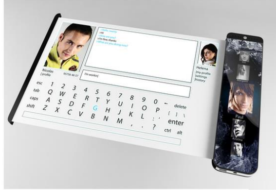
شكل (2) يوضح فيه هاتف محمول ذكي