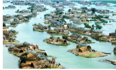
الشكل (5) مشهد لمجموعة بيوت مبنية من القصب. https://www.atlasobscura.com/places/mudhif-houses