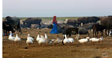
الشكل (7) فتاة من الأهوار تتوسط مجموعة من الجاموس والإوز المحلي. https://apimagesblog.com/blog/2017/10/26/iraqs-vast-marshes-reborn-after-saddam-are-in-peril-again

كانت منطقة الأهوار العراقية تضم ما يزيد عن 20000 كيلومتر مربع من البحيرات المترابطة. تبلغ ضعف مساحة مستنقعات إيفرجلايدز (Everglades) (تقع في الجزء الجنوبي من ولاية فلوريدا إحدى ولايات أمريكا المعروفة). وتعدُّ الأهوار موطنًا لملايين الطيور. وجدت دراسة أجريت عام 1979 حوالي 81 نوعًا من الطيور المائية ، بما في ذلك الطيور النادرة أو المستوطنة التي تعيش فيها. كما تُعدُّ واحدة من أهم المناطق