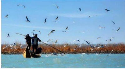
الشكل (6) عملية صيد السمك والطيور في الأهوار.