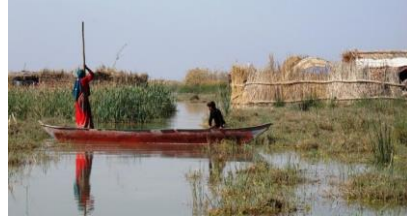
الشكل (3) يمثل صورة لبنت الأهوار وهي تنتقل بواسطة المشحوف. https://www.iraqicivilsociety.org/archives/6637