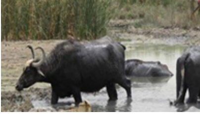
الشكل (4) مقطع لمجموعة من الجواميس العراقية ترعى في الأهوار. https://www.iraqicivilsociety.org/archives/4820