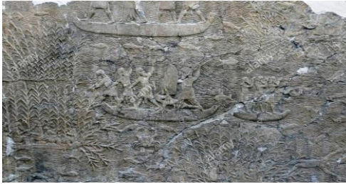
الشكل (1) جنود آشوريون القدماء على متن قارب القصب ، في مستنقعات جنوب العراق. الآشورية ، حوالي 620-640 BC من نينوى ، جنوب غرب القصر.

اكتسبت بيئة العراق منذ فجر التاريخ الى اليوم مكاناً مرموقاً لموقعها المتميز بين أقطار الشرق الأدنى القديم فتقع في قارة آسيا بجزئها الجنوبي (Baquer, 1986, p. 25). تحوي هذه البيئة نهران عظيمان توأمان هما دجلة والفرات كسما أهمية كبيرة كأهمية النيل في مصر (George, 1984, p. 23)، وساعد ذلك في حرية