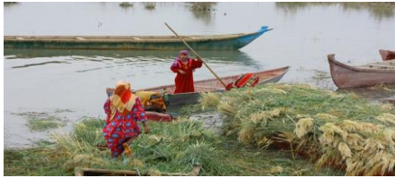
الشكل (8) عملية حش القصب (الغذاء الرئيس للجاموس) والقيام بحمله بواسطة المشحوف من قبل فتاتين من الأهوار.