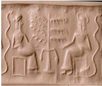
الشكل(5) ختم اسطواني يمثل: آدم وحواء تتوسطهما نخلة. المتحف البريطاني. لندن.

وفي الشكل (2) تظهر فيه مجموعة من الغزلان ترعى في بستان من النخيل بأسلوب التكرار المتناظر للأشكال رُسمت بدقة متناهية سطح عليبة من العاج رسم منقوش على عليبة من العاج وُجِدَتْ في عثر عليه في الجانبين الشمالي والجنوبي من دكة القصر الأشوري. تمثل موضوعات تصويرية وُضِعَتْ على سطوح تصويرية للوحات وأُطْرِثْ بأشرطة مزخرفة لتبدو أشبه بحشوة معمارية. وبهذا المشهد يدل على اهتمام الفنان العراقي القديم بالنخلة وتوظيفها بمواضيعه الحياتية والطبيعية كلها.