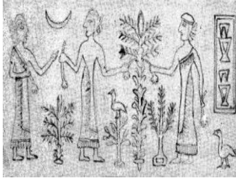
الشكل (3) يمثل مخلفات النقوش السومرية للنخل ، العهد السومري.(Reade, 1983)

على ان تكمن قدرة وقوة الخيال فيما يحقق من أثر نفسي شديد في المشاهد سواء أكان سلبياً أم إيجابياً كونه مطابقاً للحقيقة أو يخالفها فمثلاً أن رسوم الكهوف لا تعد فيها مادة بالرغم من وجودها بل ما يقع في المادة من التخيل. وهذه الرسوم لم تكُ للمتعة الجمالية فحسب بل كانت ذات مغزى رمزي سحري لتمكين الإنسان القديم من السيطرة على الحيوانات المتوحشة مصدر قوته الاقتصادي والتغلب عليها، فعندما يرسم سهم موجه إلى أحد الحيوانات كأنما يوجه لها في الحقيقة، فتلك الأشكال والرسومات تُعدُّ تعبيرات محاكية لأشكالها وصورها الحقيقية في الواقع، أي انها تحولت إلى اللغة الرمزية (Allam, 1975, p21. Reid, 1975, pp21-22).