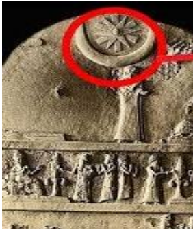
الشكل (4) منحوتة تظهر فيه النجمة والهِلال. (British Encyclopedia, 1979, Part

1: pp. 1045 and 1057 القديمة، والتمر ومنتجاته ( الدبس والبيرة والخمر والخل ) . ومما يشير الى اهميتها، ان قوانين حمورابي خصصت مواد من احكامها لزراعة النخيل والمعاملات الخاصة به ، وفرض الغرامة على كل من يهمل العناية ببستان النخل او يقطع نخلة. كانت مصدر الهام للكثير من الفنانين على مر العصور كعنصر