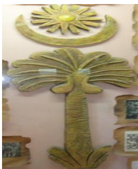
نموذج (أ) رمز النخلة والنجمة والهلال