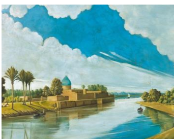
الشكل(7) مشهد نهر على ضفاف نهر دجلة ، 1920 ، زيت على قماش ، 631 × 982 مم. متحف: المتحف العربي للفن الحديث.

بعدم وجود فنانين غيرهم تناولوا الموضوعات نفسها لكن خصوصية الدراسة وعلى سبيل المثال لا الحصر اختار الباحث هذه السلسلة الفنية المتعاقبة.