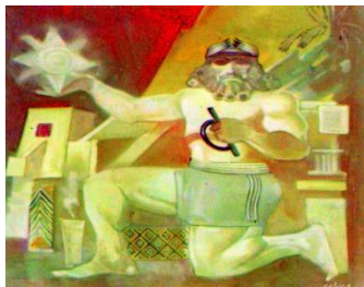
الشكل(9) تعالق التراث العراقي القديم مع الحديث. زيت على قماش.

القادر الرسام فتتلمذ على يديه فنانون عدة كان فائق حسن ابرزهم استحوذت مواضيع الطبيعة والمشاهد الريفية جل أعمالهم ومنجزاتهم الفنية كان مكان النخلة لا يفارق تلك المنجزات. يُعدُّ الفنان العراقي فائق حسن(1914-1992م) الذي تأثر بأستاذه عبد القادر الرسام وتتلذذ على يديه واحداً من ابرز فناني العراق أستطاع بعبقرية خاصة ان يغير مجرى التاريخ الفني العراقي الحديث والمعاصر. ليحقق مكانته المرموقة في الحركة التشكيلية العراقية، كواحد من أبرز أعلامها، بأسلوبه الواقعي المنفرد، اذ أنجز أعماله المتأخرة خاصةً الكبيرة منها التي تناولت مواضيع الحياة اليومية البغدادية والحياة الشعبية والخيول العربية والحياة البدوية الغربية من ارض العراق. كما انه يعدُّ واحداً من أبرز الملونين. رسم القرى الريفية الى جانب اعماله الشهيرة فأخذت طابعاً ثرائياً وتعبيرياً متمثلاً في الجو العام للبيئة العراقية عبر الفنان عنه من خلال توظيف البناء التراثي الريفي المعروف المنشأ من (اللبن وأشجار النخيل ومكوناتها) ، في موضوع له مضمونه في اتجاه توظيف الجانب الفني في التعبير عن هذا المكان بما يحويه من مفردات