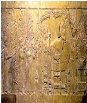
شكل(6) يمثل الملك آشور بان ابلي مع زوجته الملكة آشور شرآت في الحديقة الملكية. (Nunn, 2006, pp 20-2)

https://www.facebook.com/photo.php?fbid=1422859317855154&set